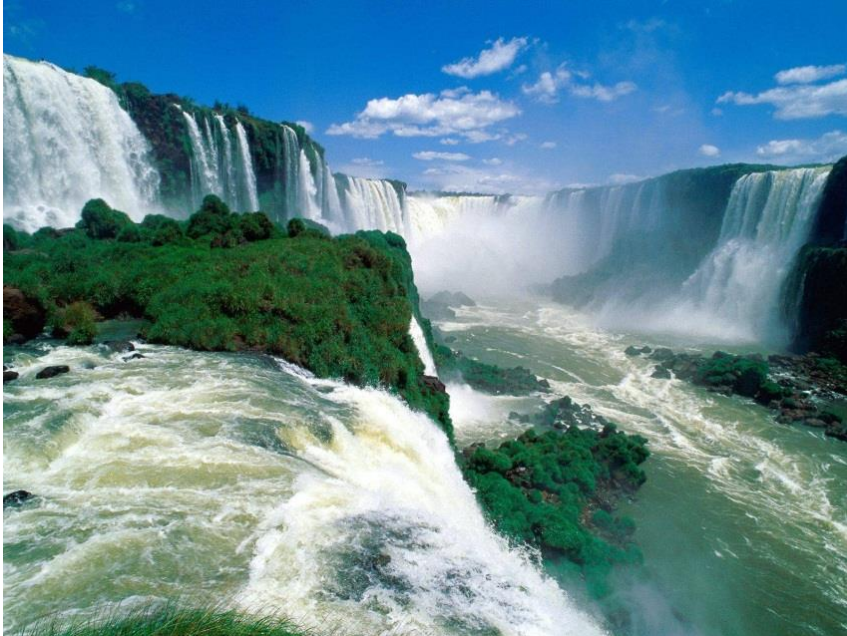
Iguazu-fallen i Novemberskrud.

är sommarens utflykter redan bokade och det kommer att gå bra men om jag känner mig själv rätt är detta det är då jag kommer att avrunda resandet och försöka fokusera på något annat. Om jag inte efter nästkommande guidesäsong har hittat något som jag brinner för här i Göteborg då kanske det är dags att se sig om efter nya jaktmarker.