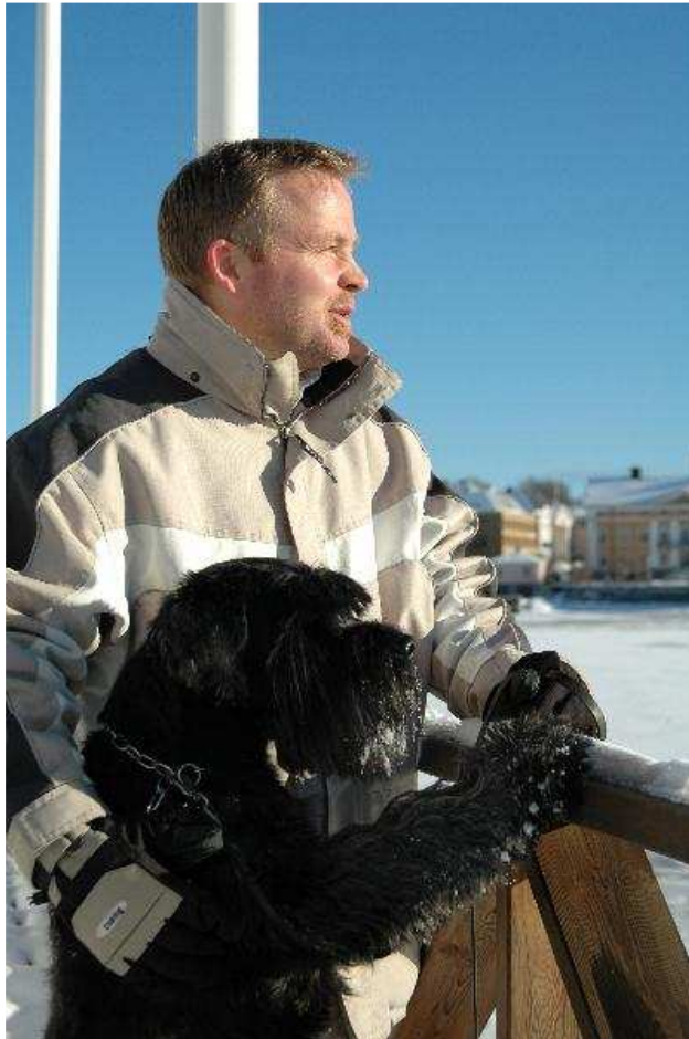
Jag och Pallas en härlig vårvinterdag